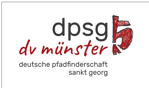
Original-Logo auf weißem Hintergrund