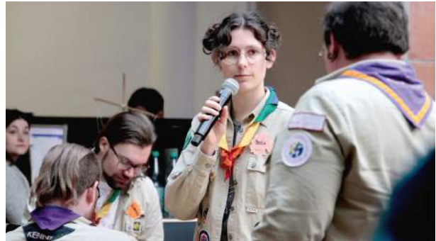
Gute technische und gestalterische Qualität