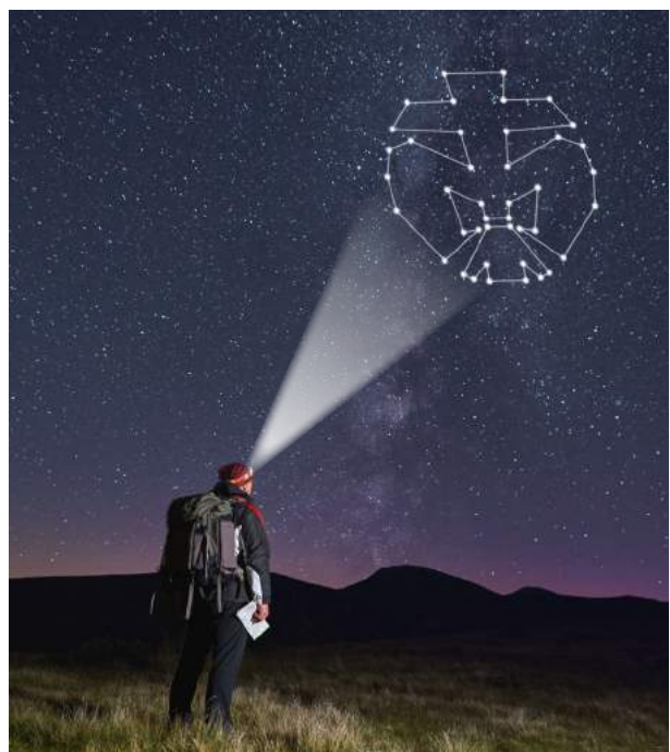
Retusche aus Stockmotiven