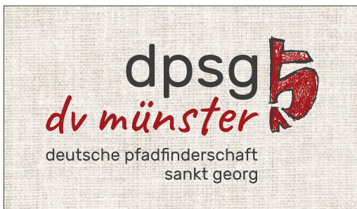
Original-Logo auf Foto – auf ausreichenden Kontrast achten!