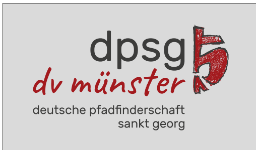
Original-Logo auf hellgrauem oder leicht transparentem Hintergrund