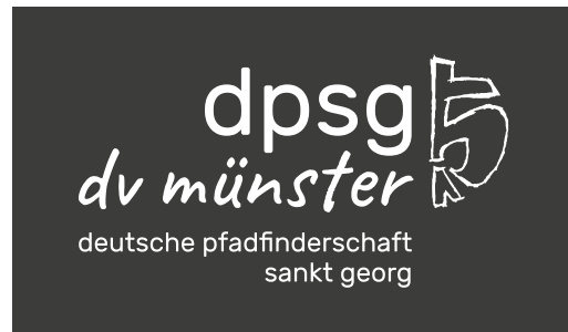
Logo negativ auf dunkelgrauem (oder schwarzem) Hintergrund