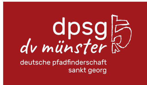
Logo negativ auf rotem Hintergrund